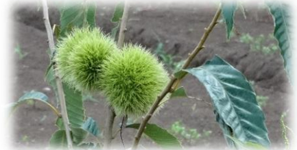
膨らんできたクリ

「残暑」が季節の言葉となる季節ですが、文字どおり「暑い」夏日となる日もあれば、昼間でも 20℃程度の肌寒い日もあり、体調管理が難しい日々です。さて、前号では、小学生を対象とした「子ども科学探検隊」(夏休み前半)について報告しました。今回は、中高生対象の「中高生サイエンスキャリアプログラム」を紹介いたします。