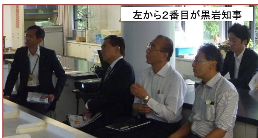
左から2番目が黒岩知事