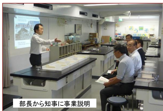
部長から知事に事業説明