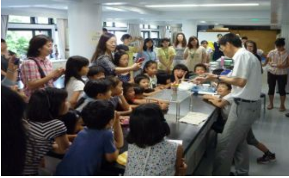
「もし空気がなくなったら」の実験。