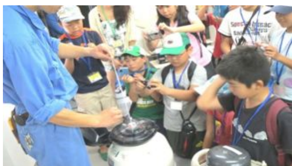
100年後200年後を見据えて絶滅危惧種の遺伝子や配偶子を凍結保存しています。