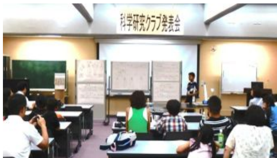
みんな、テーマを選んだ理由や苦労工夫した点についても言及して中身が濃い発表ができました。