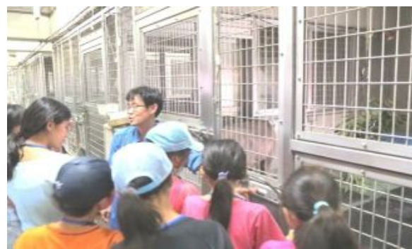
飼育棟です。ここでは希少野生動物の飼育・繁殖を研究しています。後ろの白いバクが見えますか？