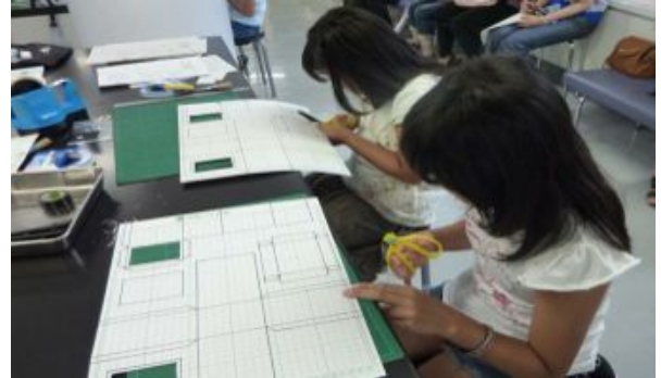
工作用紙から切り出します。