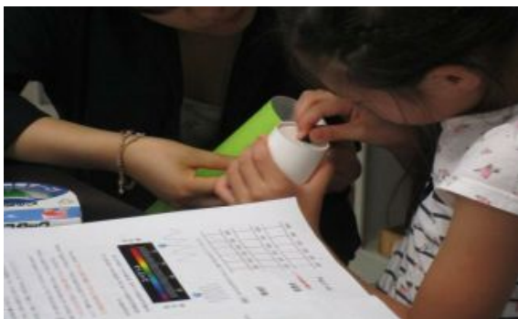
糸電話の工作。これが意外と難しいのです。