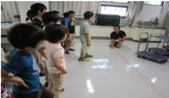
「これが縦波だよ。」バネで波を実演。

8月8日（木）小学3年生～6年生を対象に行いました。「音」と「光」はどちらも波の仲間です。20名の皆さんが、糸電話や分光器を作って、自分の耳と目で実際に体験しました。