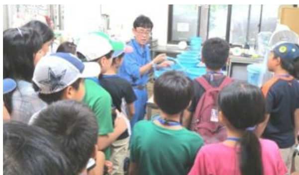
普段なかなか入れない研究施設です。とても分かりやすく説明していただきました。

A コースが 9 月 7 日（土）に横浜市繁殖センターを訪問しました。繁殖センターはよこはま動物園（ズーラシア）の敷地内にあり、希少動物を飼育する動物舎や研究を行う研究棟、そしてズーラシアの動物を診る動物病院がありました。繁殖センターの希少動物の保全活動についての説明を聞いた後、施設の見学を行いました。