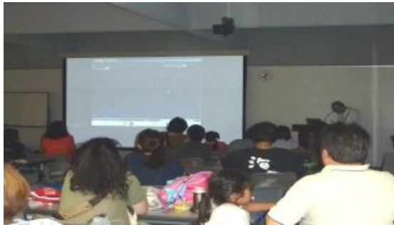
天体望遠鏡の仕組みや、月に関する講義から。