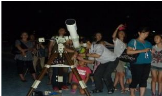
クレーターまで実によく見えました。表面は想像以上にデコボコしていました。