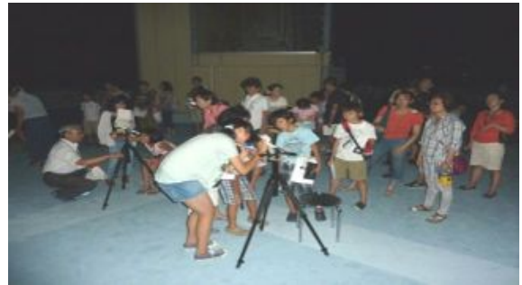
屋上に上がってよいよ月の観察です。