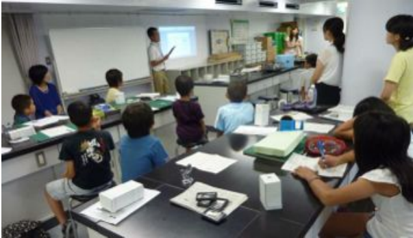
はこカメラの原理について説明を受けました。

7月25日に小学生を対象として行いました。光の性質を学びながら、簡単に撮影・現像のできるカメラを作りました。インターンシップの大学生スタッフのお兄さんお姉さんにもお手伝いいただきました。