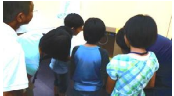
発表後の展示では、みんなが群がっていました。これは「自動販売機」のしくみを見ているところです。