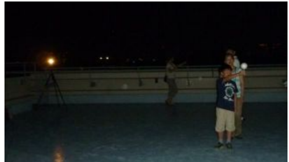
電燈が太陽、僕が地球、手にしたボールが月。月の満ち欠けがよく分かりました。