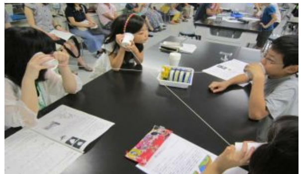
糸電話を使って4人で話をしました。