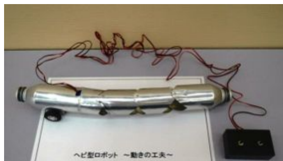
作品展示「ヘビ型ロボット～動きの工夫～」リアルな動きをお見せしたい！