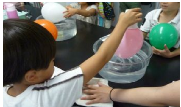
空気と水の力の実験。コップから風船が落ちません。