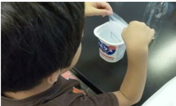
「消える金魚」の実験。金魚ばち（黒い枠）にいた金魚が消えたのが見えますか？

8月3日（土）小学1年生から3年生を対象に、いろいろな実験を体験しました。中でも光の屈折による「消える金魚」には驚きました。高校生・大学生のインターンシップのお兄さんやお姉さんにもお手伝いいただきました。