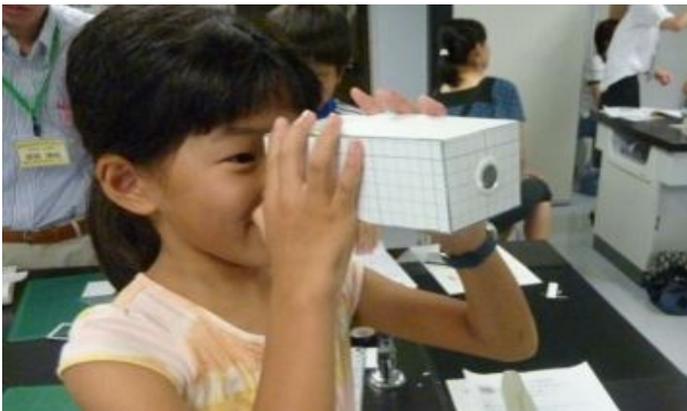
できあがり！ 何が見えますか？