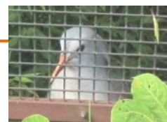
カグーです！顔を見せてくれました！