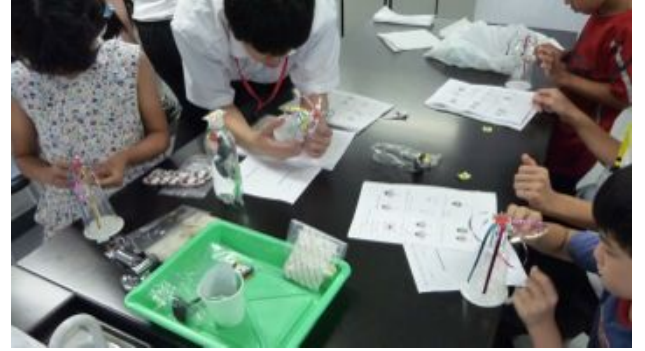
「回転レインボー」を作りました。きれい！