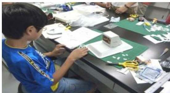
ファンにモーターをつなげます。