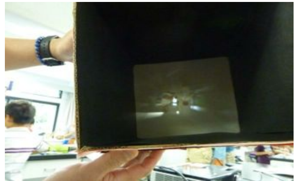
世界が逆さまに見えました。