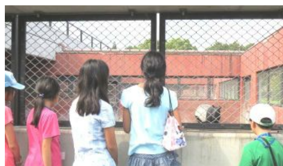
希少動物のマレーバクです。カンムリシロムクや日本にはここしかないカグーなどの珍しい鳥もいました。