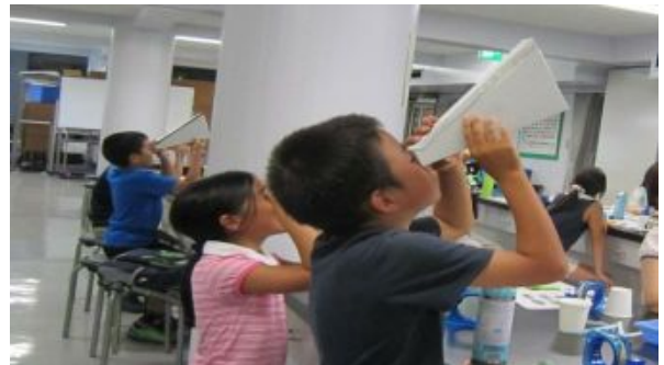
分光器を作り、光を分解しました。