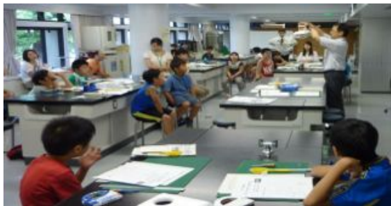
まずホバークラフトの理論から。分かりやすい説明でメカニズムがよく分かりました。

8月16日（金）小学3年生～6年生を対象に発泡トレイを使用したホバークラフトを作りました。電池でファンを回し浮き上がる本格的なホバークラフトです。できあがって動いた時は感動でした。うれしいお土産になりました。