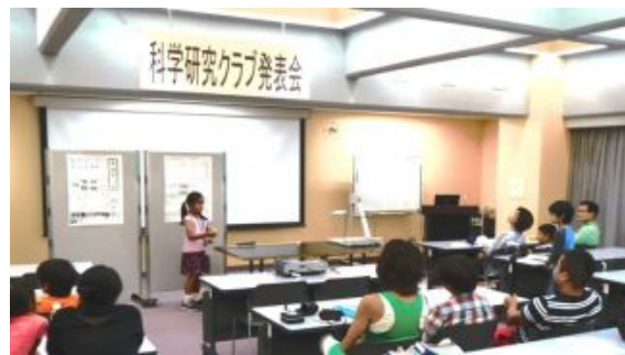
「何か質問はありませんか？」自分で調べた研究だから自信を持って答えられます。