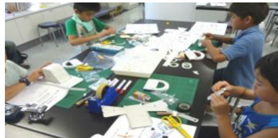
工作開始。方眼紙の切り取りから始めます。