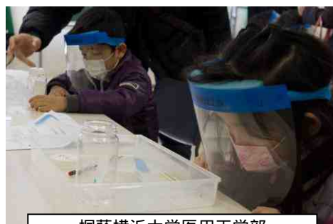
桐蔭横浜大学医用工学部 生命医工学科齋藤研究室 きみもめいたんてい! 「みどりのしみからはんにんさがし」