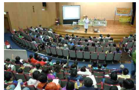
サイエンスショー おもしろ実験配達人 さとうやすし ニュートンはえらい人~力と運動のふしぎ~