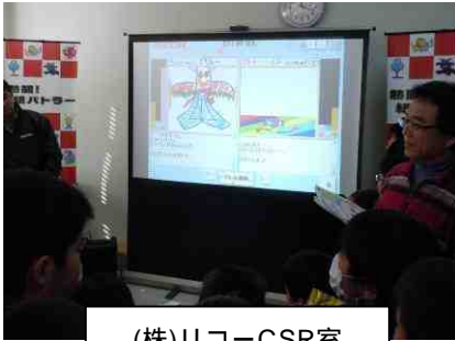
(株)リコーCSR室 熱闘！紙バトラー