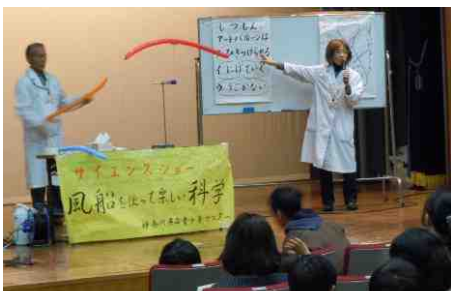
サイエンスショー おもしろ実験・科学工作指導者 せけ修了生 実験ショー 風船を使って楽しい科学!!