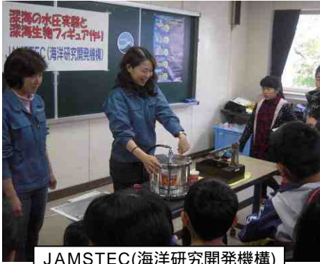
JAMSTEC(海洋研究開発機構) 深海の水圧実験と 深海生物フィギュア作り