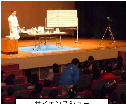
サイエンスショー 横山一郎 鉄の船が浮かぶわけ2012