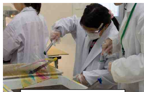
富士フイルム(株)神奈川工場 あっと驚く世界で一つの 「カラー写真」を作ってみよう!