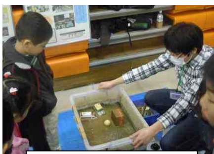
神奈川県温泉地学研究所 液状化現象を体験してみよう!