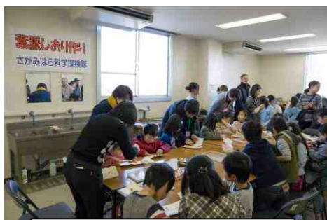
さがみはら科学探検隊 葉脈しおり作り