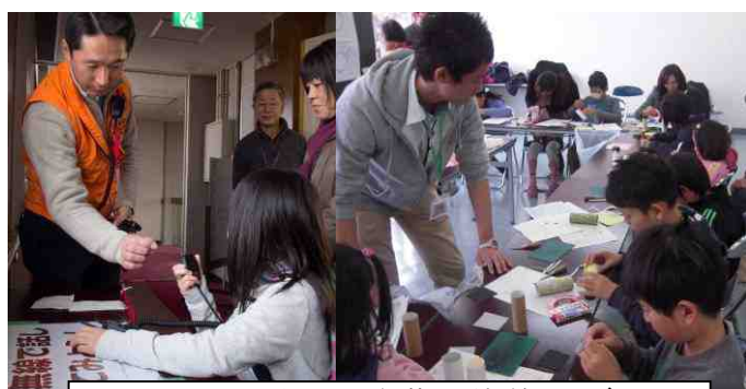
ほんままさこと紅葉ヶ丘無線クラブ 無線を体験してみよう! ピンホールカメラを作ろう!