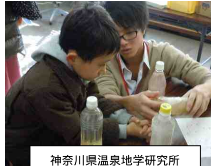
神奈川県温泉地学研究所 液状化現象を体験してみよう！