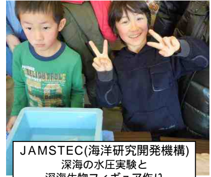
JAMSTEC(海洋研究開発機構) 深海の水圧実験と 深海生物フィギュア作り