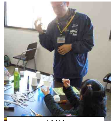
JAXA (宇宙航空研究開発機構) ロボットハンドをつくろう！

<参加者の感想> もっと時間があれば良かった。まわりきれず残念。一つ一つの説明も丁寧で、液状化、耳石など興味深かった / 子どもたちに身近なサイエンスを体験させることができ良かったです。またやっください / 今回初めて参加しました。次回も楽しみにしています。中学や高校へ行ったら化学や地学に興味を持ってそうです / 実験ショーはとても楽しめました / 低学年でも楽しめるものが増えるとうれしいです / 子どもによい体験でしたが、大人にもいろいろ勉強になるものがありました。また次回参加したいと思います / 科学に興味を持つ機会になる、とても楽しく刺激的な良いイベントだと思います /