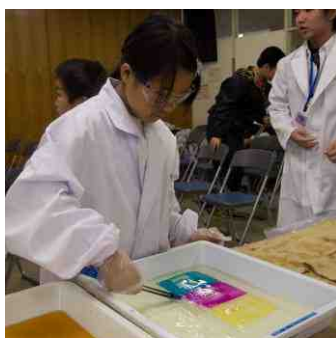
富士フィルム(株)神奈川工場 あっと驚く世界で一つの 「カラー写真」を作ってみよう!