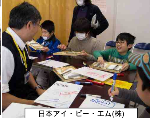
日本アイ・ピー・エム(株) Eweekボランティア・チーム TryScience 音で探る 紙の橋