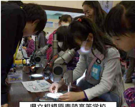
県立相模原青陵高等学校 地球惑星科学部 神奈川の鉱物発見!