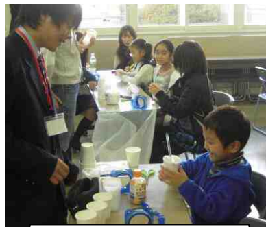
JAXA (宇宙航空研究開発機構) ロボットハンドをつくろう!