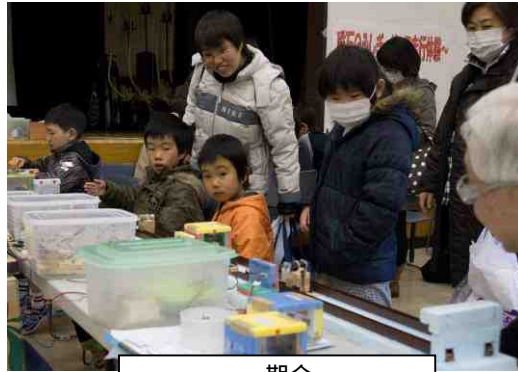
一期会 磁石のふしぎ ~リニモ走行体験~

<参加者の感想> 企画は大変だと思いますが、継続して取組めるようがんばってください/ 鉱物ブース(顕微鏡 & クイズ)の高校生がいていねいに教えてくれました/ 鉱物のことをもっと知りたい/ リニアモーターカーが浮いているのが実際近くで見れてよかった/ しおり作りが楽しかった/ ロボットハンドのお兄さんの説明がわかりやすかった/ 液状化の実験が楽しかった/ 教えてください方(ボランティア?)がとても熱心で小さい幼児でしたがとてもよく理解できました。また参加したいと思います/ 富士フィルムの方が「実験は失敗していい。何故失敗したのかを知ろう」とステキな言葉を子どもにかけてくださり感動しました。周りの大人の見守り方を教えて頂けました。子どもはロボットアームの仕組みに感動し考案者に興味を持ったようです/ ストロー笛のお姉さんが優しく、楽しかった/ 紙バトラーが楽しかった/