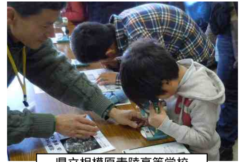
県立相模原青陵高等学校 地球惑星科学部 神奈川の鉱物発見！

<参加者の感想> もっと時間があれば良かった。まわりきれず残念。一つ一つの説明も丁寧で、液状化、耳石など興味深かった / 子どもたちに身近なサイエンスを体験させることができ良かったです。またやっください / 今回初めて参加しました。次回も楽しみにしています。中学や高校へ行ったら化学や地学に興味を持ってそうです / 実験ショーはとても楽しめました / 低学年でも楽しめるものが増えるとうれしいです / 子どもによい体験でしたが、大人にもいろいろ勉強になるものがありました。また次回参加したいと思います / 科学に興味を持つ機会になる、とても楽しく刺激的な良いイベントだと思います /