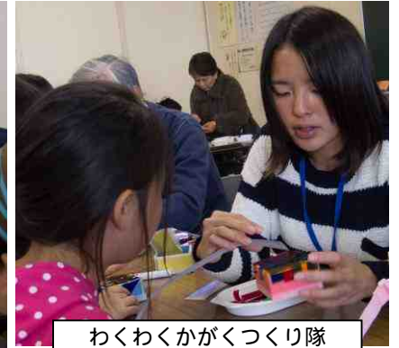
わくわくかがくつくり隊 色・いろいろ - カラーセロファンであそぼう -

<参加者の感想> 毎回楽しい企画をありがとうございます。何回か参加させていただいているうちに、物の見方、原理などを考えるきっかけになったようにも思えます / 幼稚園児や小学校低学年の子も体験できるものが多くとても楽しんでいます。サイエンスショーは「浮力」の難しい説明を、とても分かりやすく実験を通して教えてもらいました。また来年も参加したいです / 子どもたちがとても楽しそうでした。またこういうイベントをやってください / 去年とは違うプログラムで、とても楽しめました。来年もまた行きたいです /