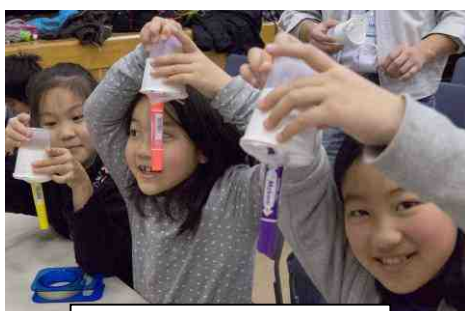
JAXA (宇宙航空研究開発機構) ロボットハンドをつくらう!