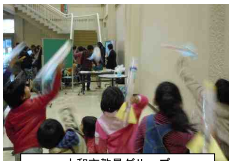
大和市教員グループ 「理科を好きになろう会」 かさ袋ロケットをつくって飛ばそう!