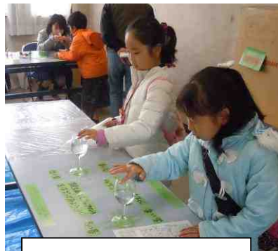
上和田中学校科学部 見てさわって楽しむ科学作品