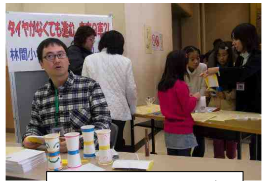
林間小学校教職員グループ タイヤがなくても進む、未来の車?!