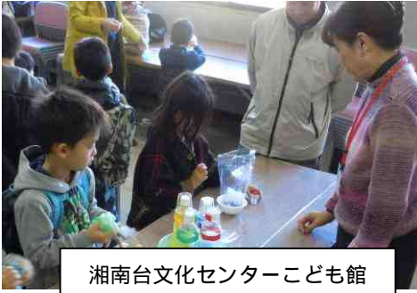
湘南台文化センターこども館 カラフルな色水でスライムを作ろう