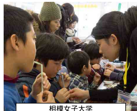
相模女子大学 子ども教育学科理科教育教室 ストロー笛を作りましょう!