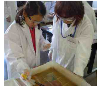
富士フイルム(株)神奈川工場 あっと驚く世界で一つの 「カラー写真」を作ってみよう！