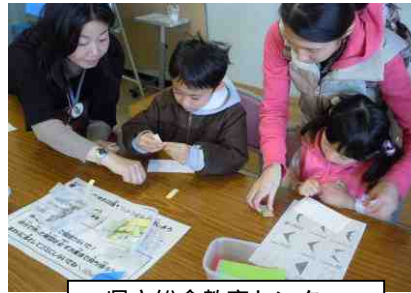
県立総合教育センター 光通信を体験しよう 身近なタネを調べてみよう