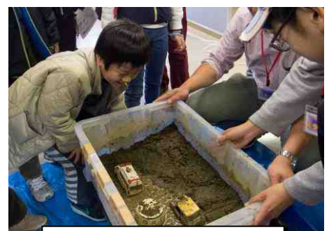
神奈川県温泉地学研究所 液状化現象を体験してみよう!