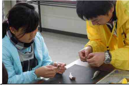
FRA(水産総合研究センター) 煮干しから耳石(じせき)をとりだしてみよう