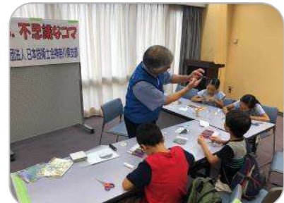
日本技術士会神奈川支部 協