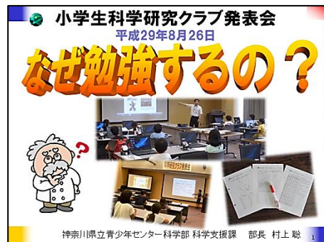
部長ミニ講話のスライドから→ (手前味噌ながらたいへん好評でした!)