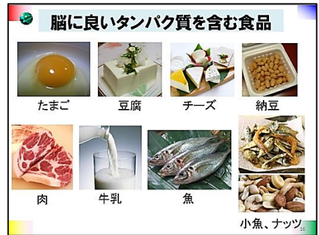
↑部長ミニ講話のスライドから (自画自賛ながら好評でした!)

その後、事務局(科学部長)から、“ 桃太郎とかぐや姫の物語を科学的に分析して、食事の大切さを考える ”という部長ミニ講話を理事の皆さんにご清聴いただきました。(この講話は、青少年センター科学部の事業「高校生天文講座」の修了式で科学部長から高校生達に話したものです。)