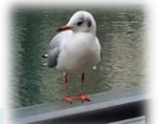
川岸のカモメ(横浜駅西口付近で事務局撮影)→

新年が明けて、関東地方は冬晴れの穏やかな日が続いています。15℃近くまで気温が上がった日もあり、これは3月並みの気温だそうです。一方で、北陸地方などでは30年ぶりの大雪。市街地でも日常生活に支障のあるほどの積雪です。しかし、子ども達はどの地方でもどのような天候でも元気いっぱいです。