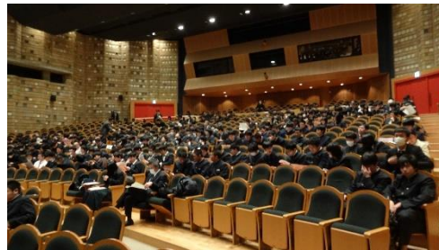
各校の発表を聞く高校生たち

審査の結果、「最優秀賞」は川崎総合科学高校、「神奈川県工業教育振興会長」は向の岡工業高校、「青少年センター館長賞」は小田原城北工業高校が受賞しました。