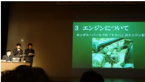
ステージ上で発表する代表生徒

1月19日(金)、青少年センターのホールで「神奈川県工業高等学校生徒研究発表会」が開催されました(青少年センター共催)。県内の工業高校中心に11の代表がそれぞれの研究成果の発表を行いました。