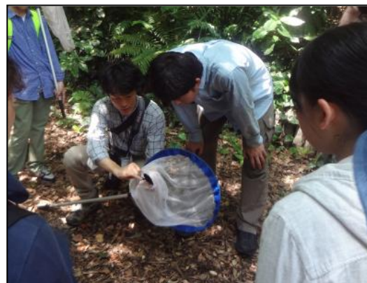
〈横須賀市自然・人文博物館〉